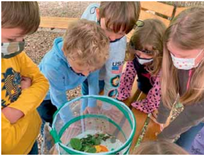
Abschiednehmen von den Faltern