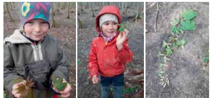
Manche Blätter sind noch ganz klein zusammengefaltet.

Schon im Herbst konnten die Kinder an den Bäumen die kleinen Knospen erkennen. In diesen kleinen Rucksäcken warteten schon die Blätter und Blüten für die neue Saison. Im Frühjahr schwollen die Knospen immer mehr an und mit den ersten warmen Tagen reckten sich die neuen Blättchen dem Licht entgegen. Staunend sammelten die Waldläuser die unterschiedlichen Blattformen, die nach einem kräftigen Regen am Boden lagen. Gemeinsam sortierten sie die verschieden großen Blätter des Ahorn und konnten so die Entwicklung von der Knospe zum fertigen Blatt wie in einem Zeitraffer nachlegen und verfolgen.