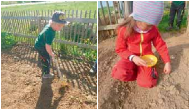
Erstmal alles gründlich hacken.