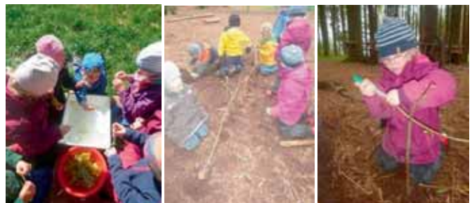
„Schau mal, mein Stängel ringelt sich schon ein!“