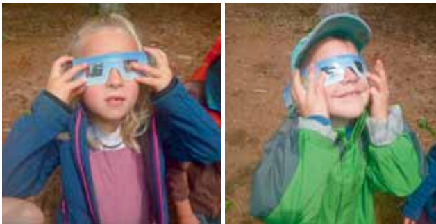
Wirklich, an der Sonne fehlt ein Stück!