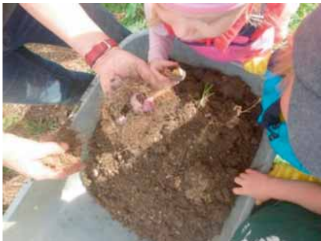
Ein kleines Mäusenest war im Kompost versteckt.