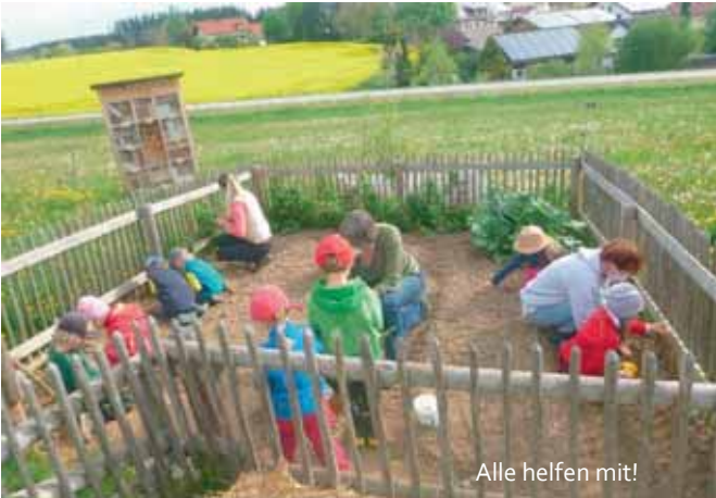
Alle helfen mit!