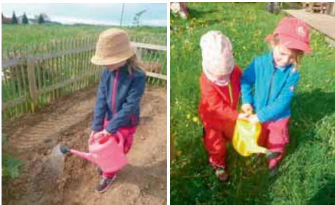
Gründlich gießen, damit es gut wächst.