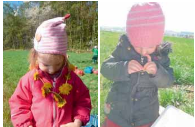
Eine goldene Kette für die kleine Prinzessin.

Und da der Löwenzahn in vielen Ländern der Erde wächst, gibt es auch einen bunten Geschichtenstrauß mit Löwenzahnanekdoten aus anderen Ländern.